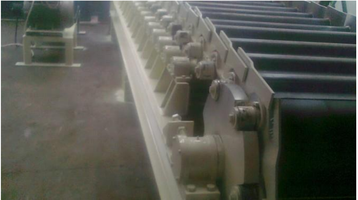
Çelik palet Konveyör